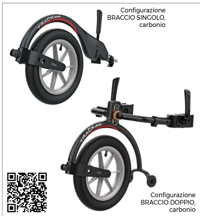
Configurazione BRACCIO SINGOLO, carbonio